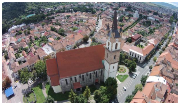
Beszterce madártávlatból