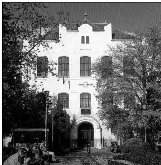
Bolyai Farkas Líceum

1718-ban a marosvásárhelyi schola particula életének új korszakába lép; 1718. április 30-án egyesül az ellenreformáció egyik áldozataként otthonából kiűzött, és Marosvásárhely skólájától menedéket kérő sárospataki református kollégium diákjaival és professzoraival. Az egykori schola particula kollégiummá, azaz főiskolává válik, Marosvásárhelyi Református Kollégium megnevezéssel.