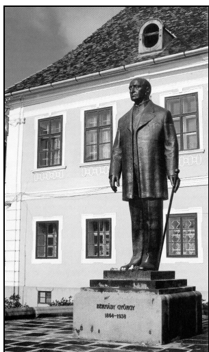
Bernády György szobra a Teleki Téka előtt

Ezt a sétát ajánljuk mi is kedves vendégeinknek marosvásárhelyi tartózkodásuk befejezéseként.