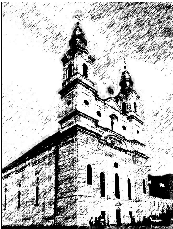
A csíksomlyói kegytemplom

Csíksomlyó méltán sorolható Európa leghíresebb zarándokhelyei közé. Napjainkra a székely nép összetartozásának és megmaradásának szimbólumává nőtte ki magát.